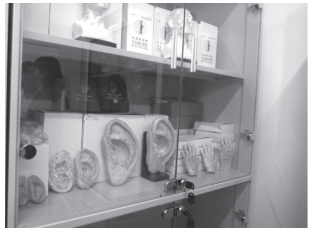
写真2 経絡モデル（耳、手）