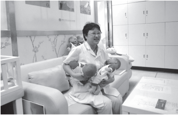
写真26 母乳育児相談室と乳房管理者

2012年、佐藤香代教授より病院幹部職（看護部看護師長）30数名を対象に、招聘講演「日本の周産期の現状、看護教育の現状、および妊婦の産み育てる力を育む妊婦教育－身体感覚活性化マザークラスの哲学と実践－」が行われた。講演終了後、日本に在籍する助産師数や助産院の現状、会陰切開率、体重管理の実際など予定時間を超過するほど多くの質問があった。さらに「もっとマザークラスの具体的な内容を知りたい」「身体感覚活性化マザークラスを中国で行ってほしい」といった要望が多く聞かれ、異国であっても専門職としての興味、関心は同じであることを感じるとともに、中国において行われているマザークラスの内容に興味を持った（写真27, 28）。