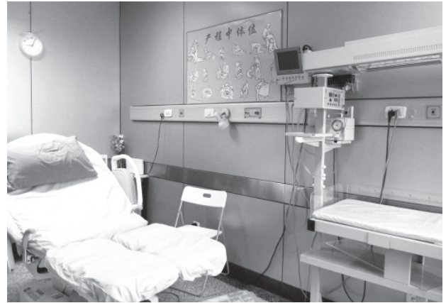
写真22 分娩室（北京婦幼保健院）