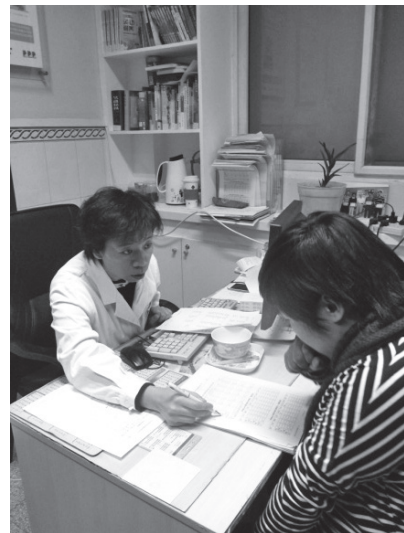
写真33 栄養士による栄養指導