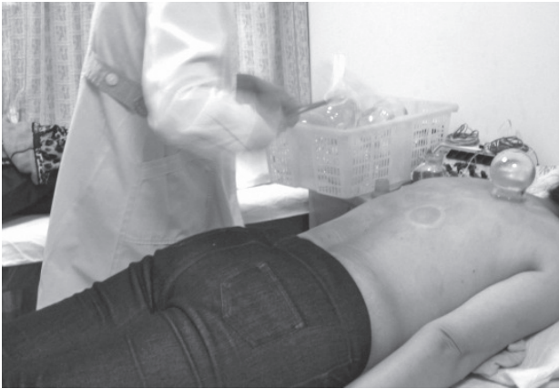
写真16 ぼっかん 拔罐療法