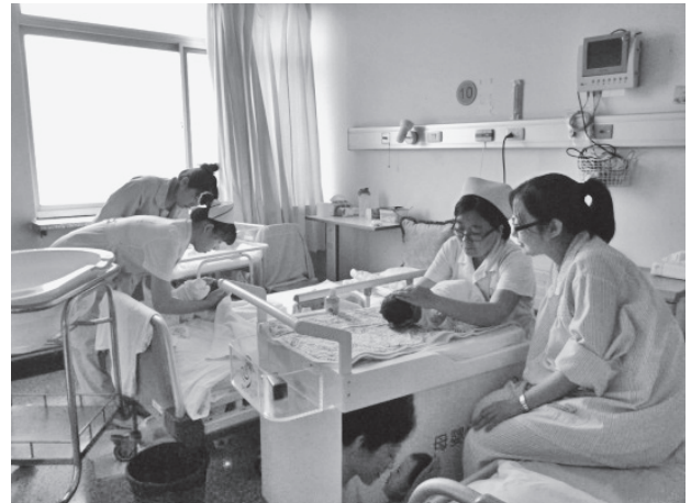
写真24 褥室での健康教育の様子