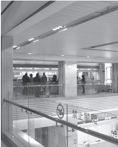
写真11 薬局（西洋医学）

合病院として機能している（病床数431床）。そのため病院を訪れると受付で「西洋医学または中医学のどちらの診療を希望するか」を問われ、希望した医学での診療を受けることができるシステムとなっており、院内には西洋医学と中医学の薬局2つが存在した（写真11, 12）。