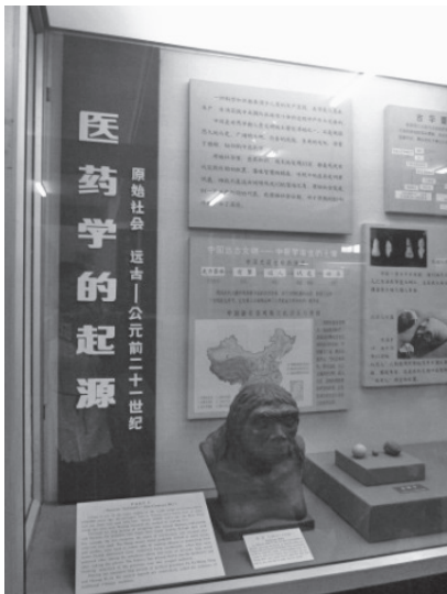
写真7 中医药学の起源