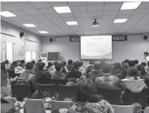
写真32 母親教室風景

北京婦幼保健院では妊娠中の大幅な体重増加や妊娠糖尿病の増加が問題視されていたが、海淀区妊幼保健院では徹底した妊婦への栄養教育、運動教育が行われており、大幅な体重増加とそれに伴う異常分娩は北京婦幼保健院ほど多くはない（写真33）。