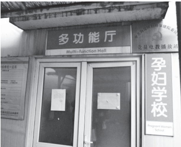
写真30 妊婦教室会場