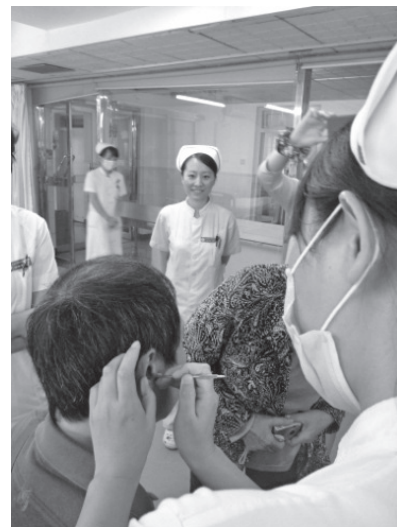
写真10 看護師による耳鍼

ル病院としての役割を持つ。具体的な看護の内容としては足浴（1万回/月実施）、浣腸、耳鍼（耳へ鍼によって機械的な刺激を与えることで、病気の治療や予防を行う）、温灸、拔罐療法などである。看護職員は約500名で、専門看護師も30名以上在籍している（糖尿病、腫瘍、ICU、手術室など）。看護教育の体制も緻密に組み立てられ、教育・医療・研究の三位一体の病院としてトップランクを誇っている。看護体制は患者1人に対し看護師0.4人（中国厚生省；看護体制目標 患者：看護師1：0.4）であり、恵まれていると言えよう（写真10）。