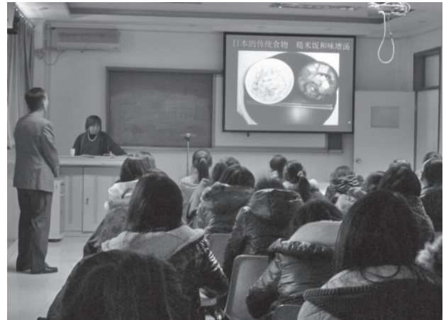
写真5 佐藤香代教授による招聘講演

で、必ず医師が立ち会う)。講義終了後の質疑では、男子学生より「なぜ女性しか助産師になれないのか」など活発に質問し、時間の関係で教員が質問を制するほどであった。中国学生の海外への興味の高さに驚かされた(写真5, 6)。