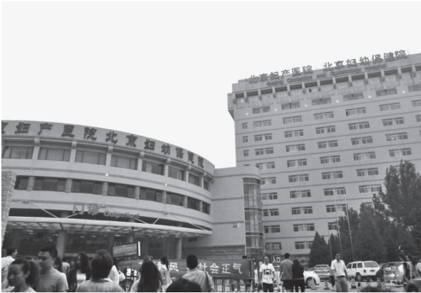
写真21 北京婦幼保健院