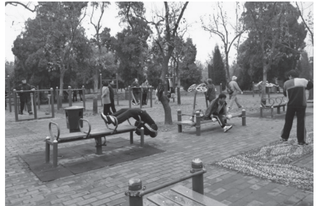
写真20 運動を行う人々