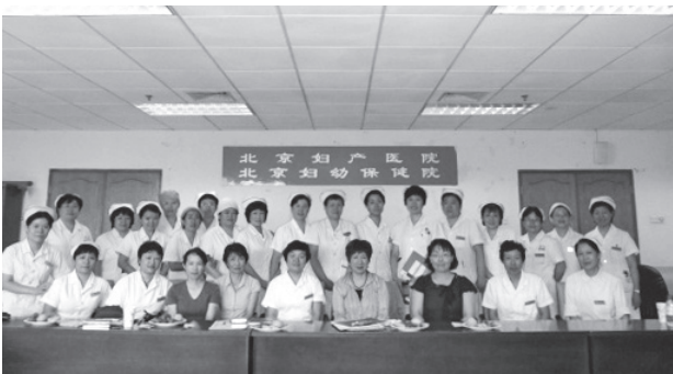
写真28 北京婦幼保健院の皆さんと筆者ら