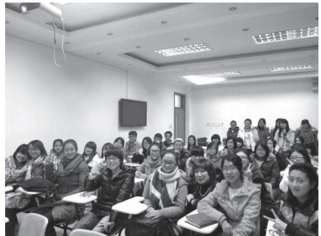
写真6 招聘講演を聴講した学生

大学構内には「中医薬学博物館」が設けられており、中医学の起源と発展の歴史が解説されている。植物や動物の内臓を原料とした漢方薬の種類の豊富さに感嘆するとともに、古代から健康を意識した生活を送っていた中国伝統の智慧の深さに感銘を受けた(写真7, 8, 9)。