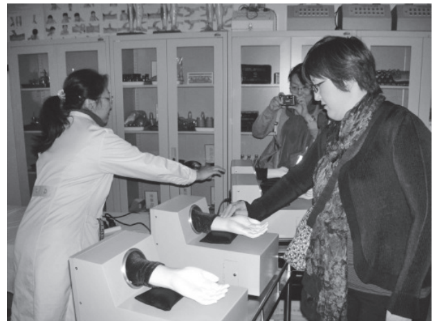
写真1 脈診演習モデル

护理学院（看護学部）では、西洋の看護学教育だけでなく中医学を取り入れた講義や演習が多く行われており、特に人間の身体を診る伝統診断法の1つである脈診を重視していた。演習では48種類の脈診を体験できるモデルを使用して学習が行われていた。また鍼灸や拔罐療法（ガラスの球体でツボを「吸う」ことで経絡を刺激し、血行促進、リンパ液の循環改善などに効果がある）も活発に行われており、中医学の技が日常の看護に浸透していることを実感した（写真1、2）。