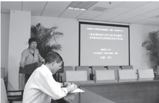
写真27 佐藤香代教授による招聘講演

2012年、佐藤香代教授より病院幹部職（看護部看護師長）30数名を対象に、招聘講演「日本の周産期の現状、看護教育の現状、および妊婦の産み育てる力を育む妊婦教育－身体感覚活性化マザークラスの哲学と実践－」が行われた。講演終了後、日本に在籍する助産師数や助産院の現状、会陰切開率、体重管理の実際など予定時間を超過するほど多くの質問があった。さらに「もっとマザークラスの具体的な内容を知りたい」「身体感覚活性化マザークラスを中国で行ってほしい」といった要望が多く聞かれ、異国であっても専門職としての興味、関心は同じであることを感じるとともに、中国において行われているマザークラスの内容に興味を持った（写真27, 28）。