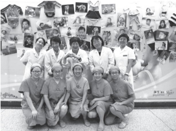
写真23 北京婦幼保健院助産師と筆者ら