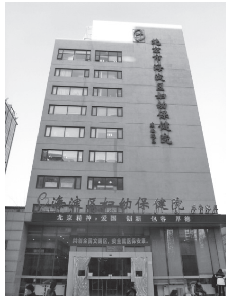
写真29 北京市海淀区妇幼保健院

北京市海淀区妇幼保健院は1983年に設立された産婦人科、小児科専門の病院であり、基本的にリスクの低い妊婦を対象としている（写真29）。